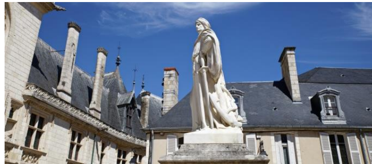
Abbildung von Städten in der Zeit der Renaissance

Die Ausstellung stützt sich auf das nicht vorhandene Abbild von Jacques Cœur und stellt die Frage nach den verschiedenen Porträtformen des menschlichen Antlitzes im Laufe der Jahrhunderte.